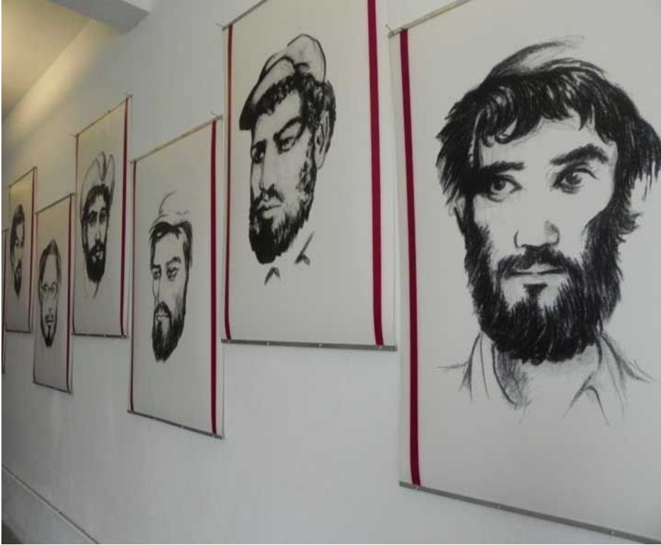
Dibujos de identificación realizados por un compañero del Che Guevara bajo tortura. Deliberadamente alteró algunos rasgos para evitar el parecido.

Katz da un espacio importante a una serie de dibujos de identificación realizados a partir del testimonio de un compañero del Che Guevara obtenido bajo tortura, y limita la cantidad a doce miembros del grupo, tal vez con un sentido religioso.