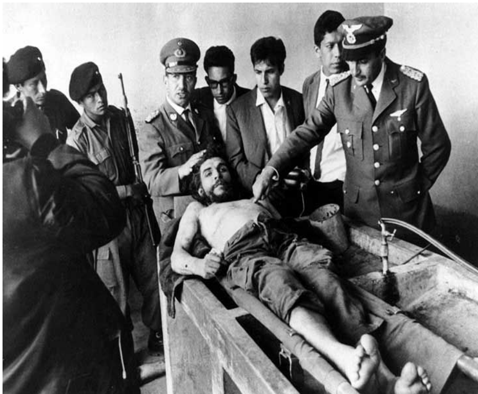
Foto de Freddy Alborta del cuerpo del Che Guevara. (c) Freddy Alborta.

En el marco de la exposición Fundación PROA organiza diversas actividades de educación y extensión gratuitas para niños, jóvenes y adultos.